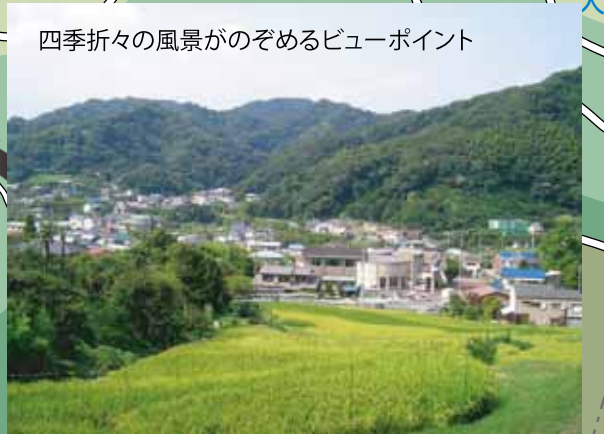
四季折々の風景がのぞめるビューポイント