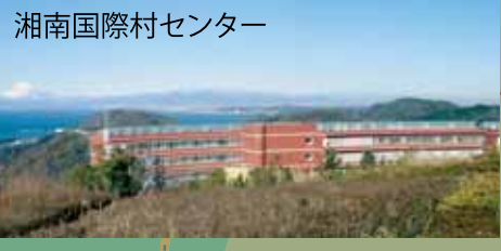
湘南国際村センター