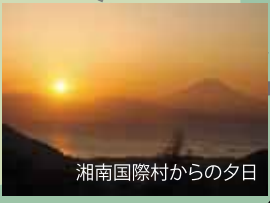
湘南国際村からの夕日