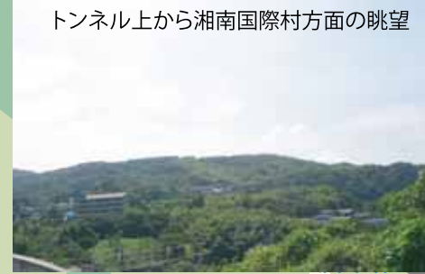
トンネル上から湘南国際村方面の眺望