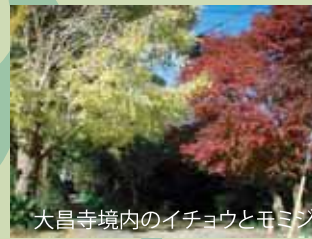
大昌寺境内のイチョウとモミジ